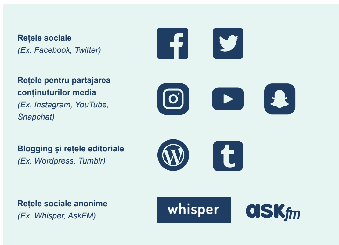
Figura 4. Câteva exemple de social media

Poate fi util, de asemenea, să se identifice diferite categorii de social media și să se discute despre cum anume funcționează, care este publicul țintă și de ce le folosește lumea. Social media include: