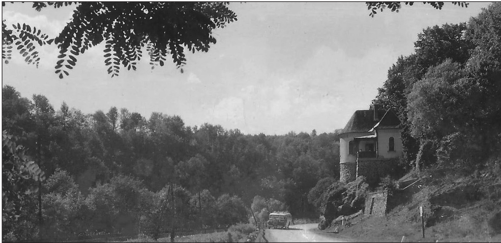
Ciucea la 1927