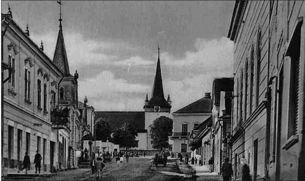
Huedin la finele anilor 1920