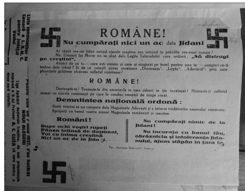
Manifest antisemit răspândit cu ocazia Congresului studențesc de la Oradea.